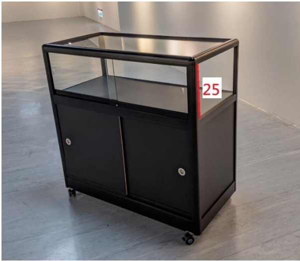
7、玻璃金屬展示櫃-黑 (100cm*100cm*50cm)