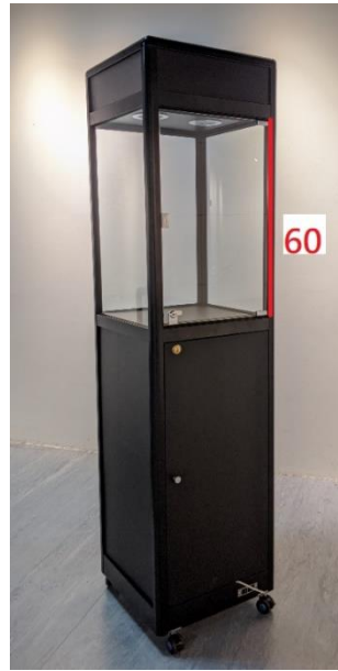
8、玻璃金屬展示櫃-黑 (180cm*45cm*45cm)